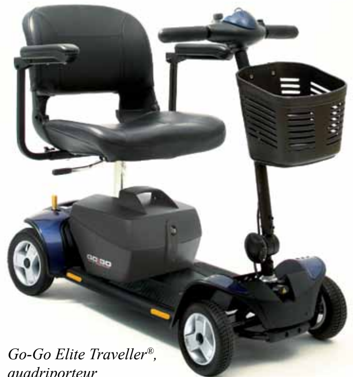
Go-Go Elite Traveller® , quadriporteur