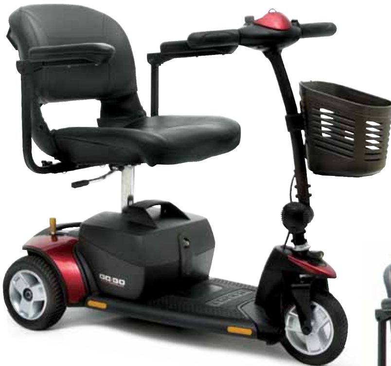
Go-Go Elite Traveller® , triporteur

Le Go-Go Elite Traveller® est facilement transportable et manoeuvrable dans des espaces restreints. Il vous offre une versatilité de style et de couleurs grâce à ses coquilles interchangeables en un rien de temps. Le design compact du Go-Go Elite Traveller vous donne accès aux corridors et autres endroits étroits, tout en vous assurant une grande stabilité à l'extérieur. Il est tellement facile à assembler et à désassembler que vous éliminerez une grande partie de l'insécurité liée à vos voyages. Allez sans tracas où vous le désirez avec le Go-Go Elite Traveller.