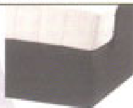
Sommier - Noir Contours - Noir