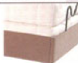
Sommier - Assorti Contours - Taupe