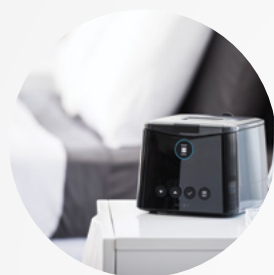
Compact et silencieux

Toute nouvelle situation peut s'avérer difficile et nécessiter un temps d'adaptation. Le traitement par PPC ne fait pas exception. Nous avons cherché à comprendre vos interactions au quotidien avec votre nouvel appareil F&P SleepStyle™ et à les rendre aussi faciles que possible, pour vous permettre de vous installer et de commencer, tout simplement.